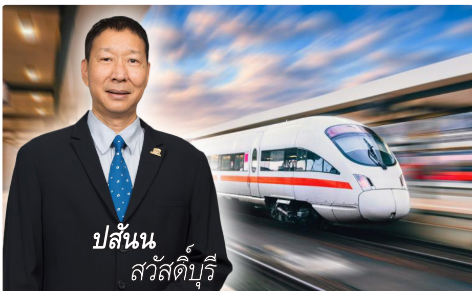
ปล้นน สวัสดิ์บุรี

■ ร.ฟ.ท.อนุมัติสัญญา3-2 ■ ยอดBacklogแตะ2.6หมื่นล.